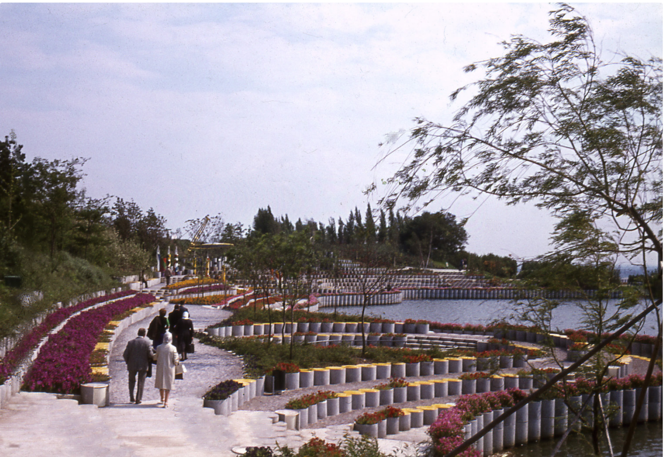
Erich Hanke, Partygarten auf der WIG 74, Wien, 1974