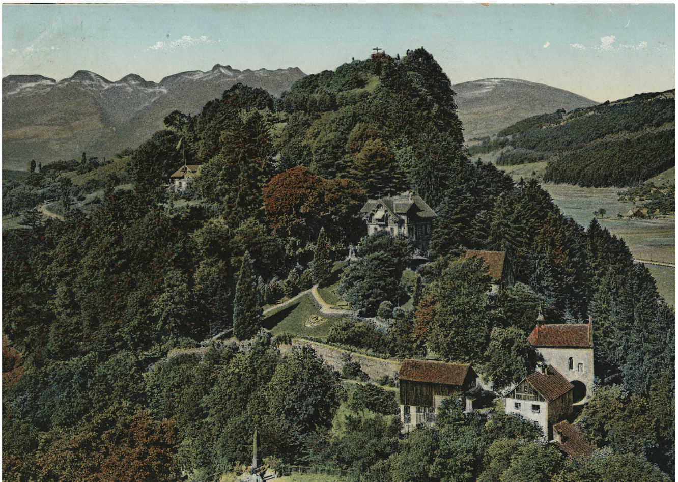
Villa Tschavoll, Margarethenkapf Feldkirch, 1905