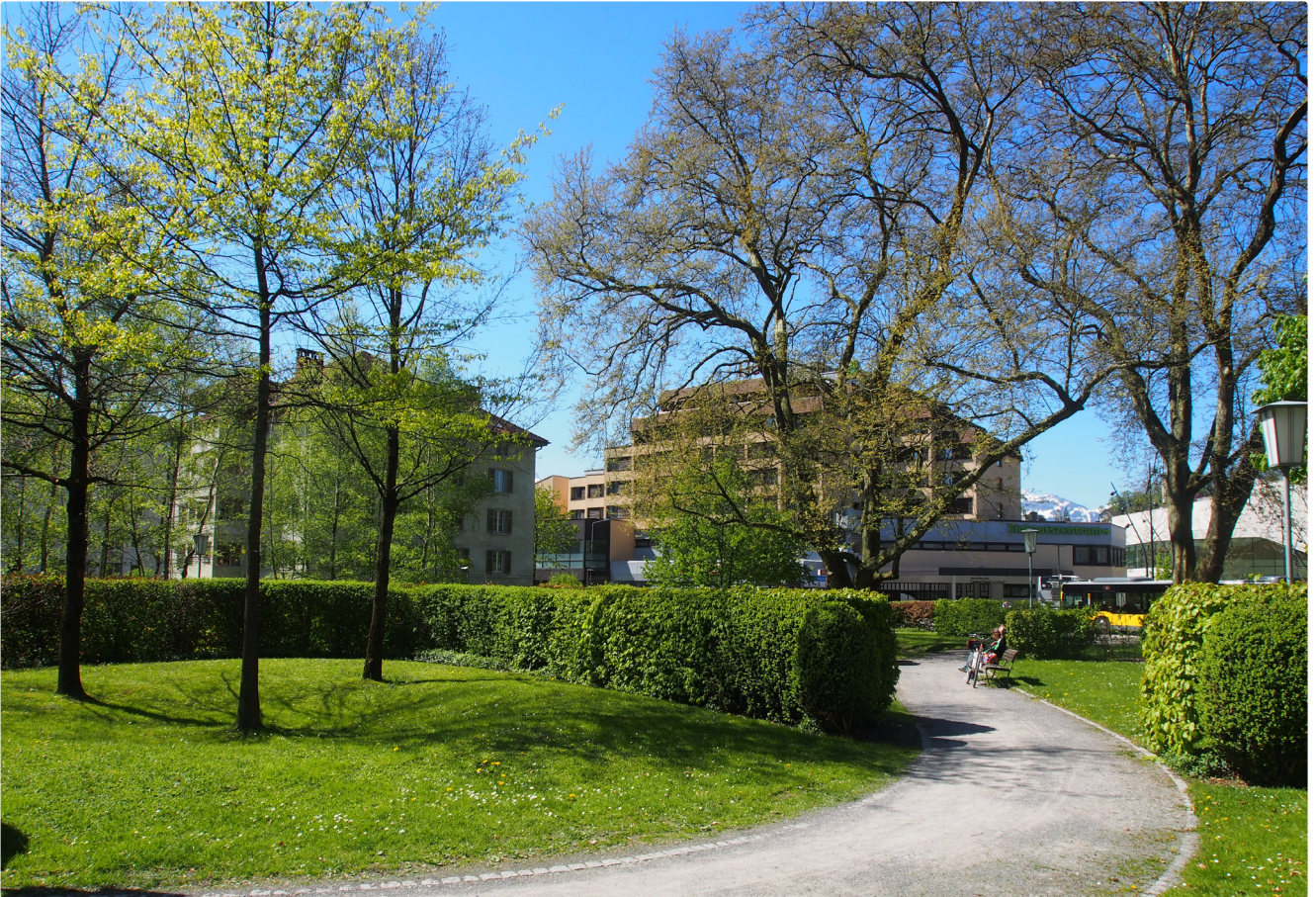
In Feldkirch entsteht aus der Spende des Bürgermeisters Tschavoll (1875) der heutige Rösslepark. Umgestaltung 2004 durch Vogt Landschaftsarchitekten.