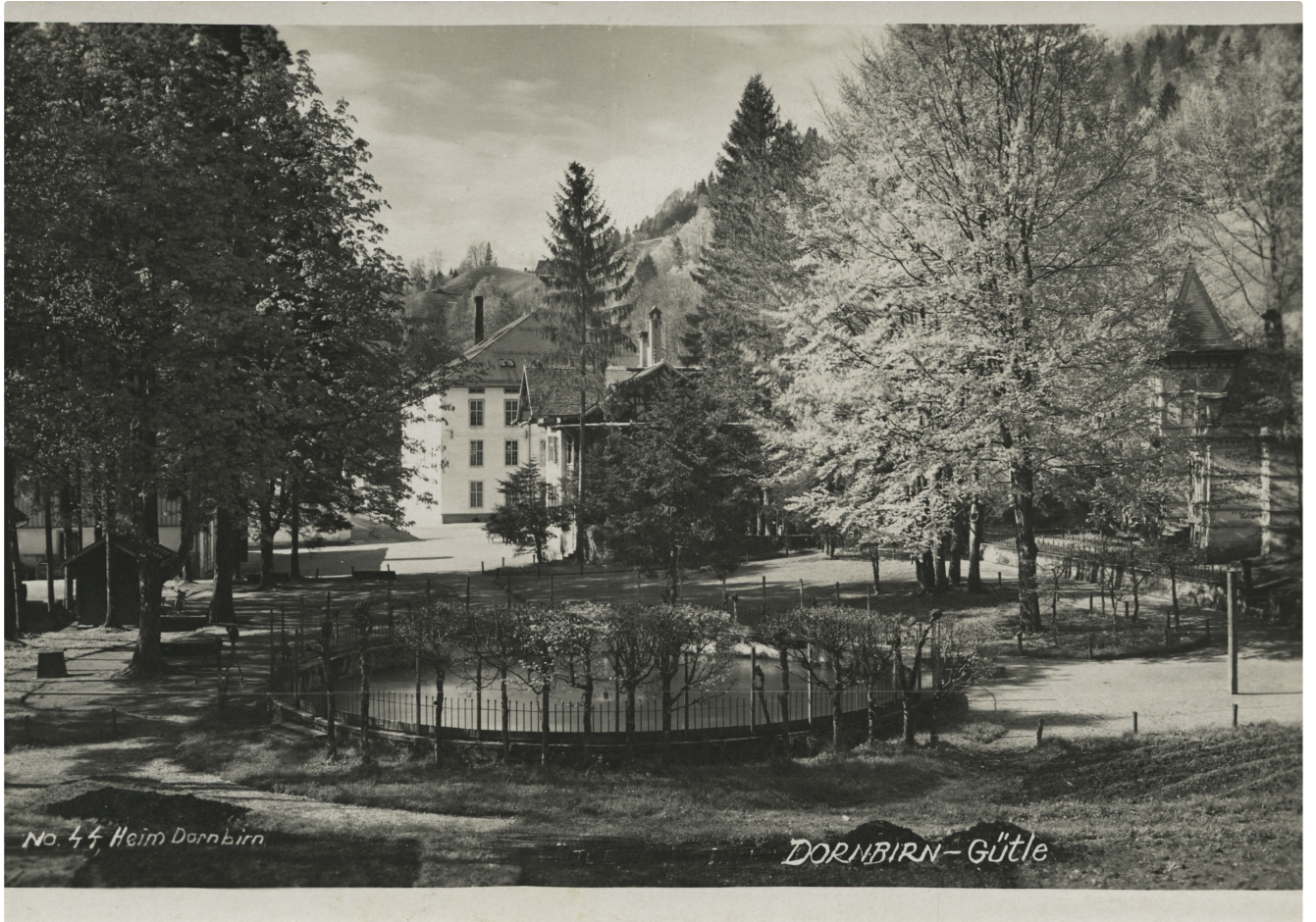
Güttele, Dornbirn, vor 1930