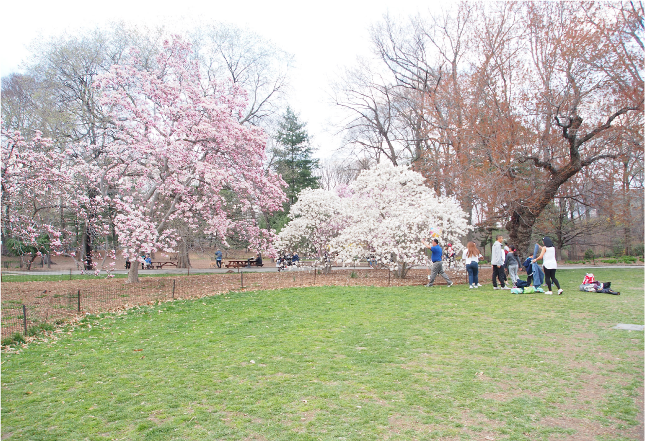
Blüten und Wiesen im New Yorker Central Park (Landschaftsarchitekten Olmstead und Veaux 1863)