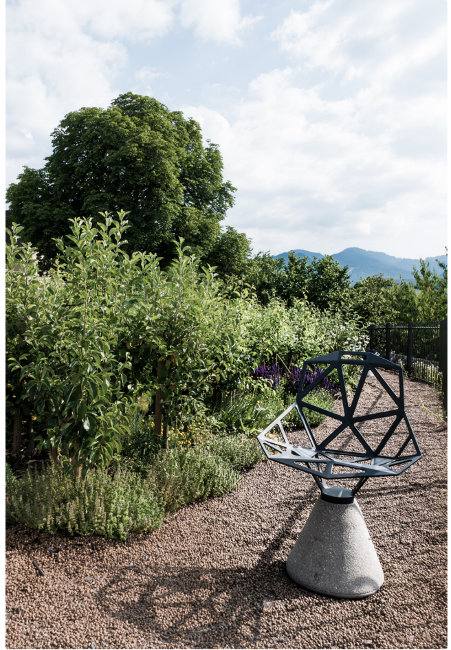
Rankweil, Pfarrers Garten