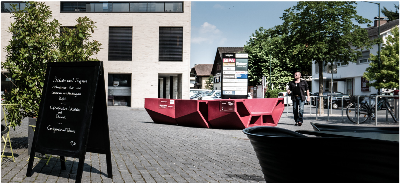
Wiener Stadtmobiliar in Rankweil, 2017