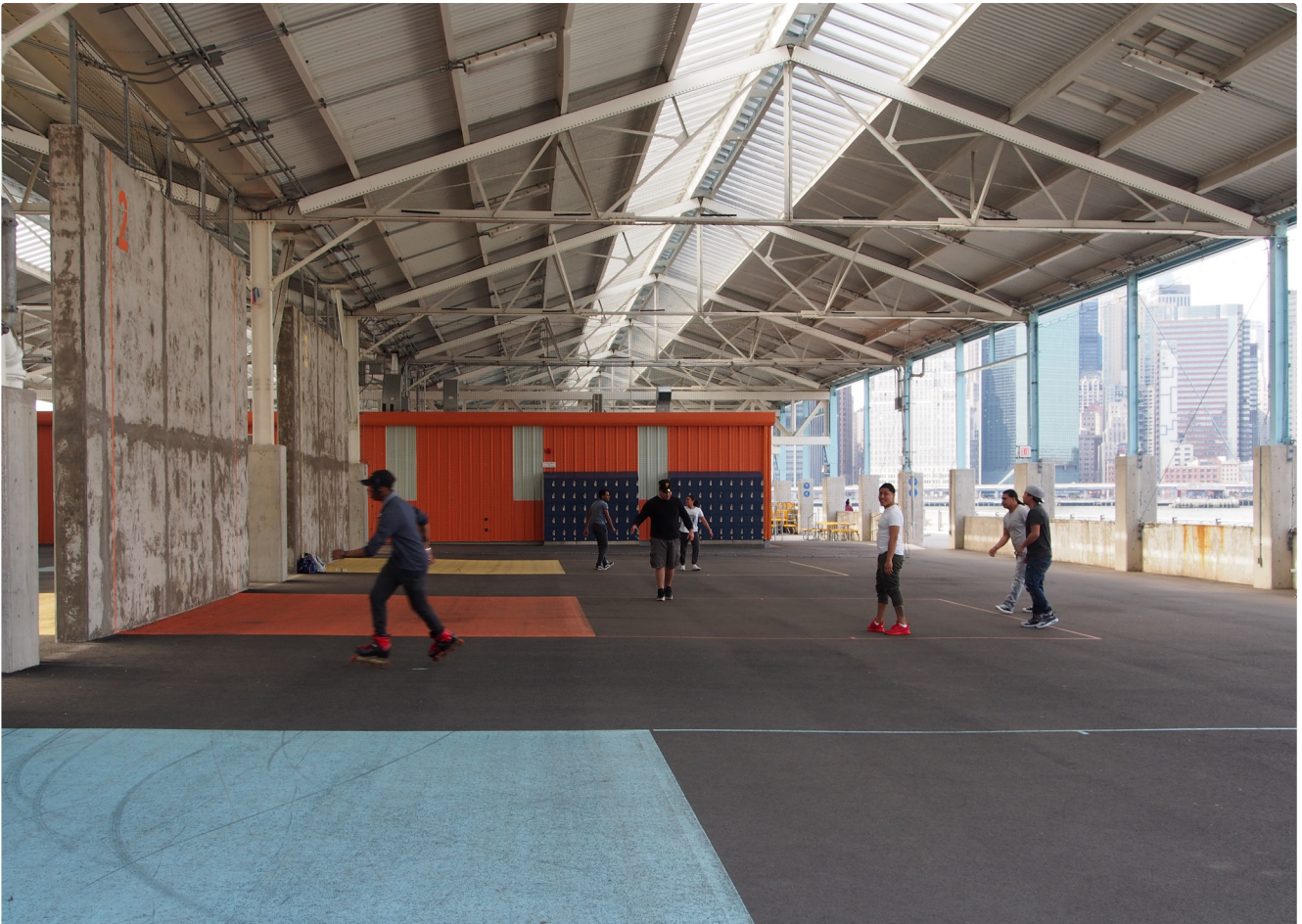
Lagerhallen zu offenen Sportplätzen: Brooklyn Bridge Park (Landschaftsarchitektur Van Valkenburgh, seit 2003)