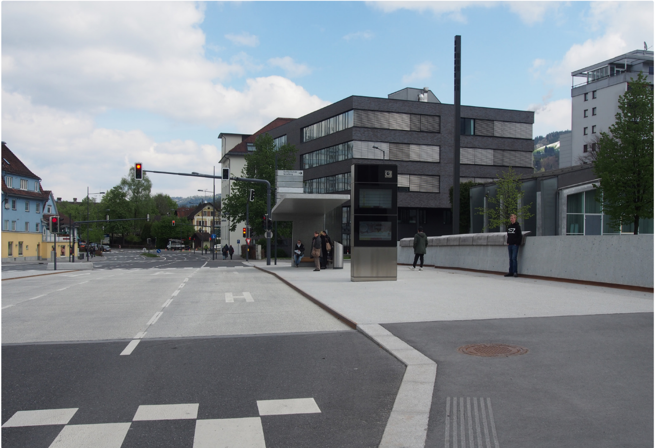
Die Sägerbrücke über die Dornbirner Ach als öffentlicher Raum: Warte- und Aussichtsort. (Umgestaltung Hugo Dworzak 2016)