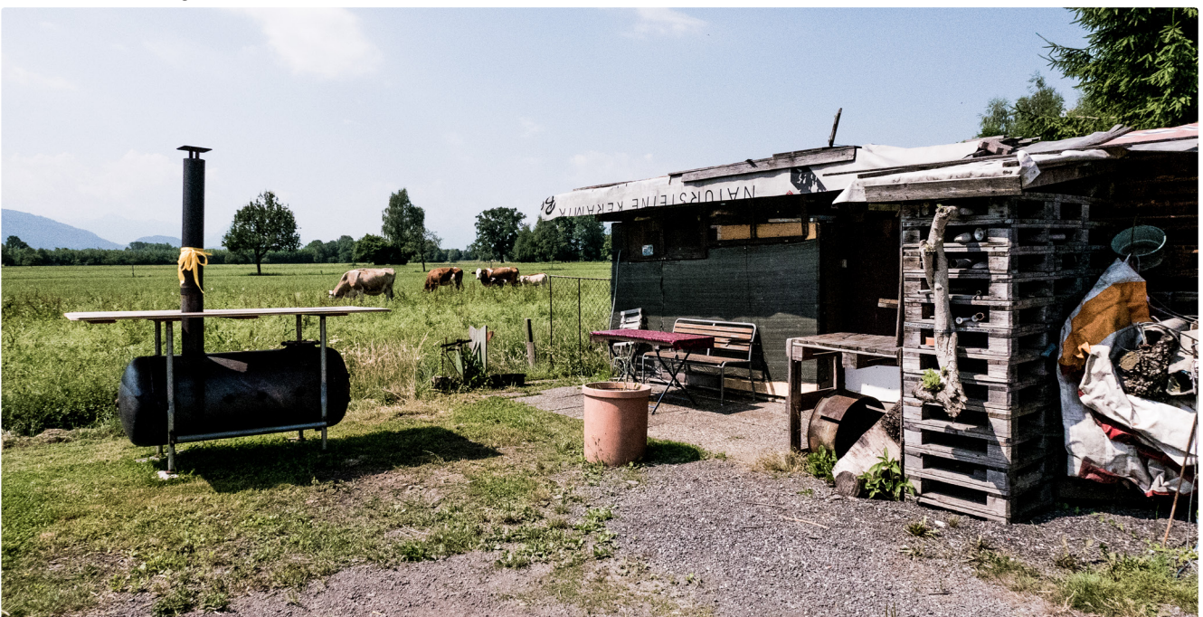
Lustenau, Riednutzung 3