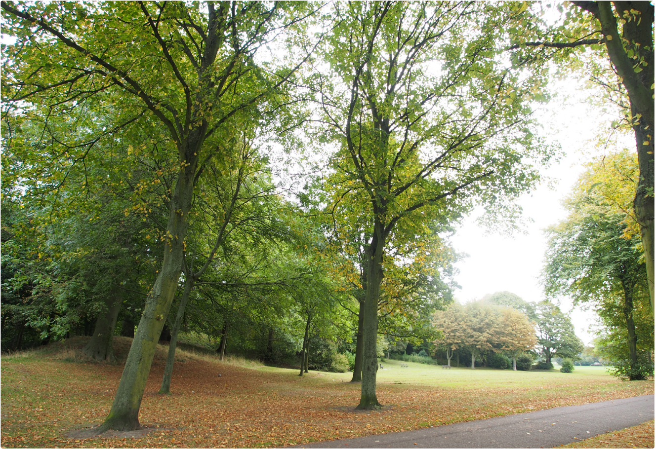
Der Birkenheadpark für die Arbeiterschaft aus Liverpool ist ein klassischer englischer Landschaftsgarten (1847)