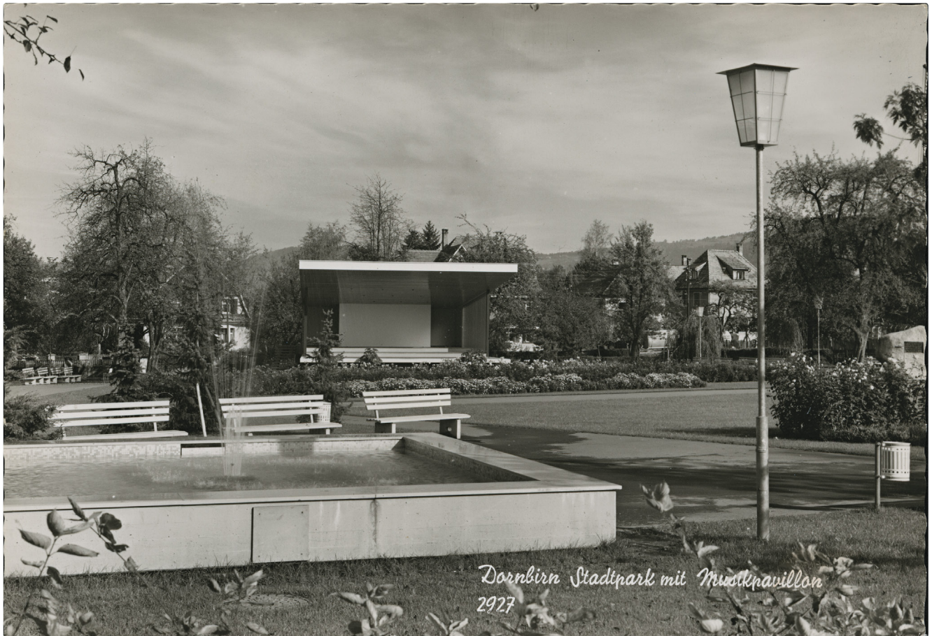
Stadtpark Dornbirn, nach 1960