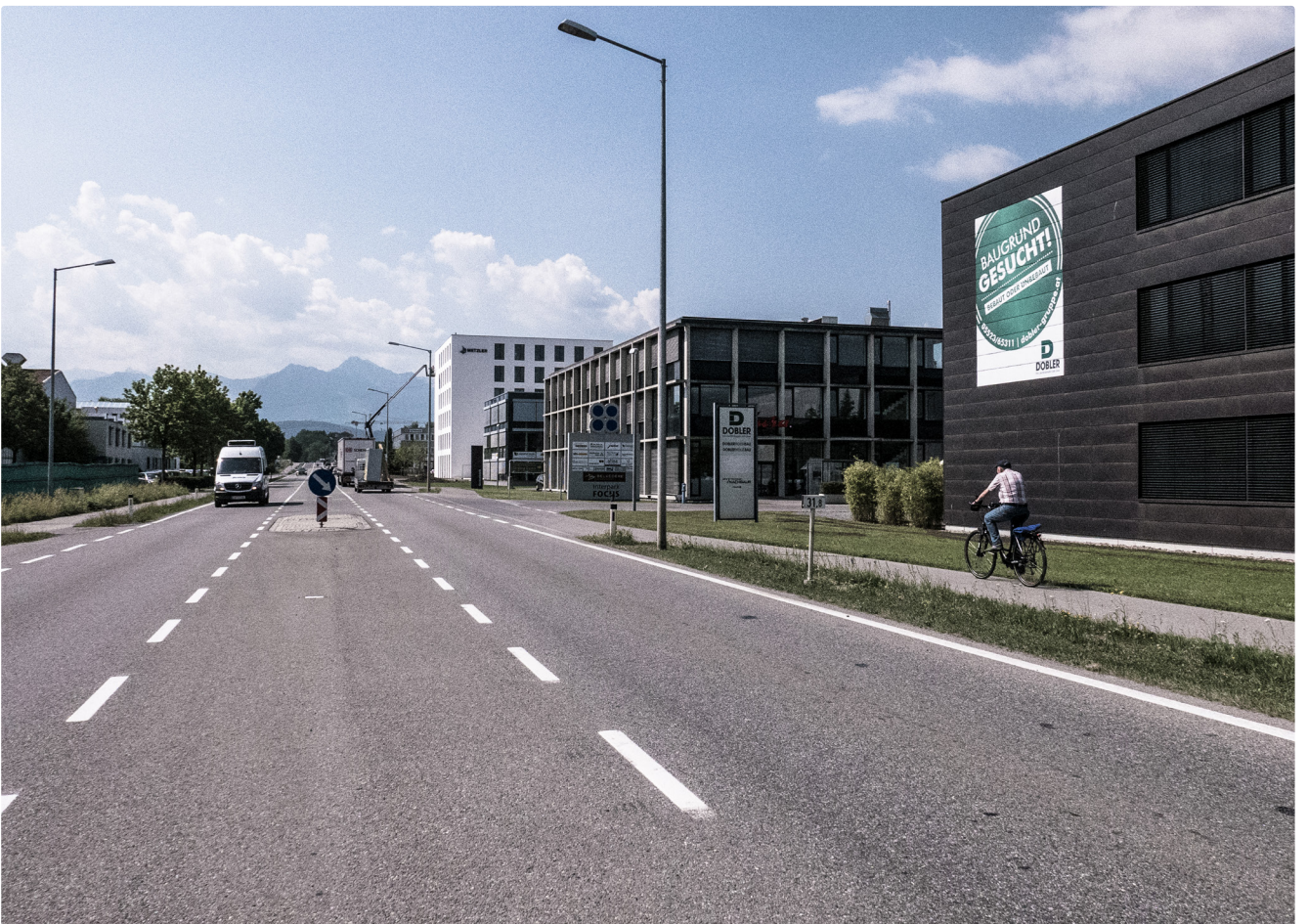
Interpark Focus 2017