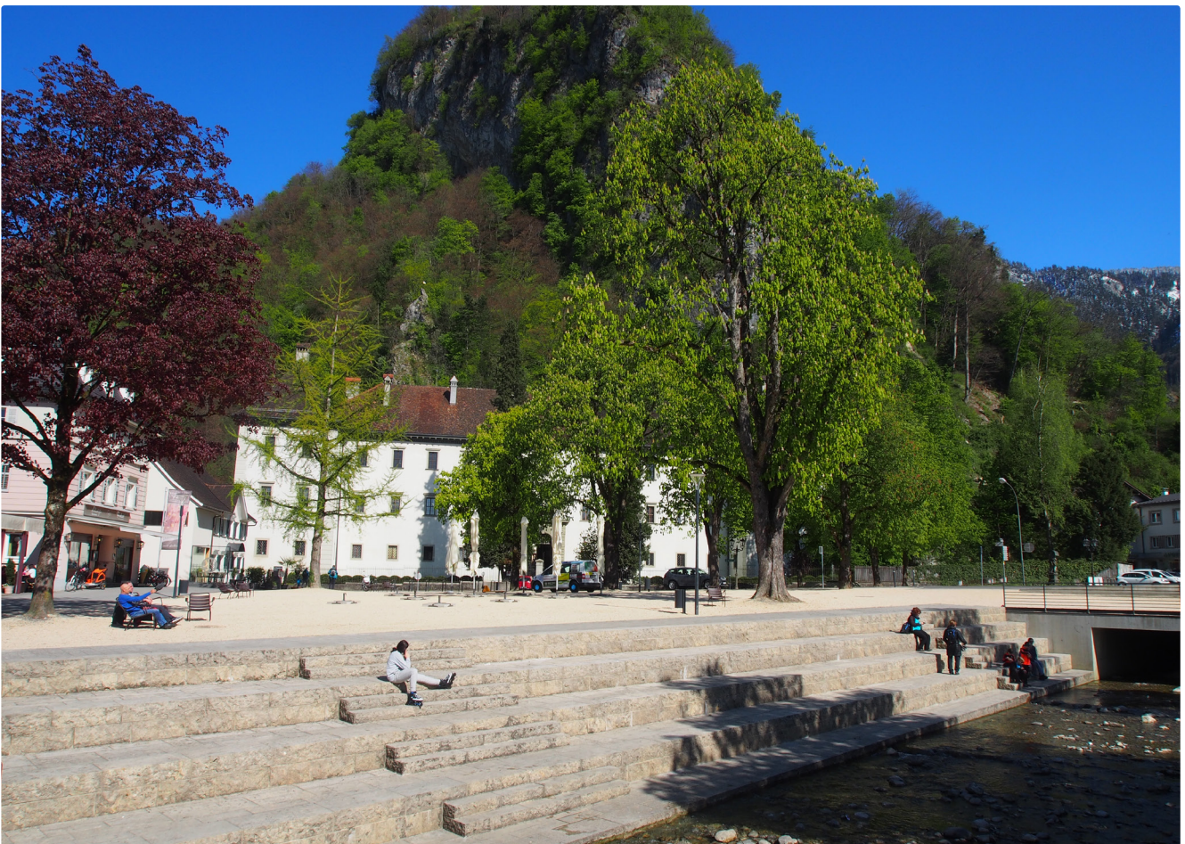
Zentral gelegene Plätze sind wichtige Teile des öffentlichen Raumes (Schlossplatz Hohenems, Neugestaltung 2016)