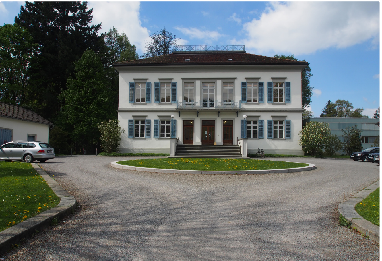
Die Stadt Bregenz hat mit dem öffentlichen Thurn und Taxis Park einen denkmalgeschützten historischen Garten. (Parkpflegewerk und Erneuerung: koselička 2009)