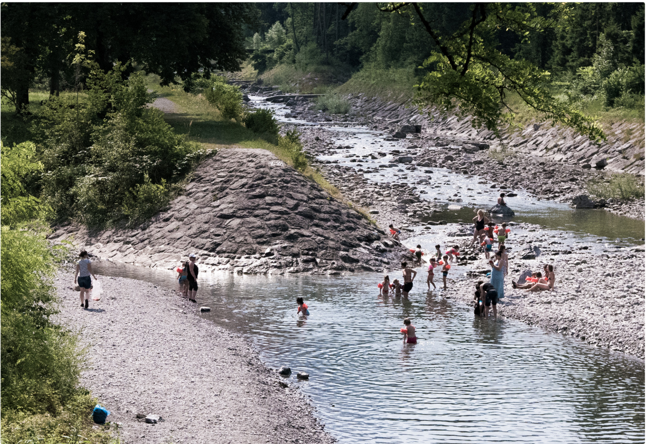
Frutz und Frödisch