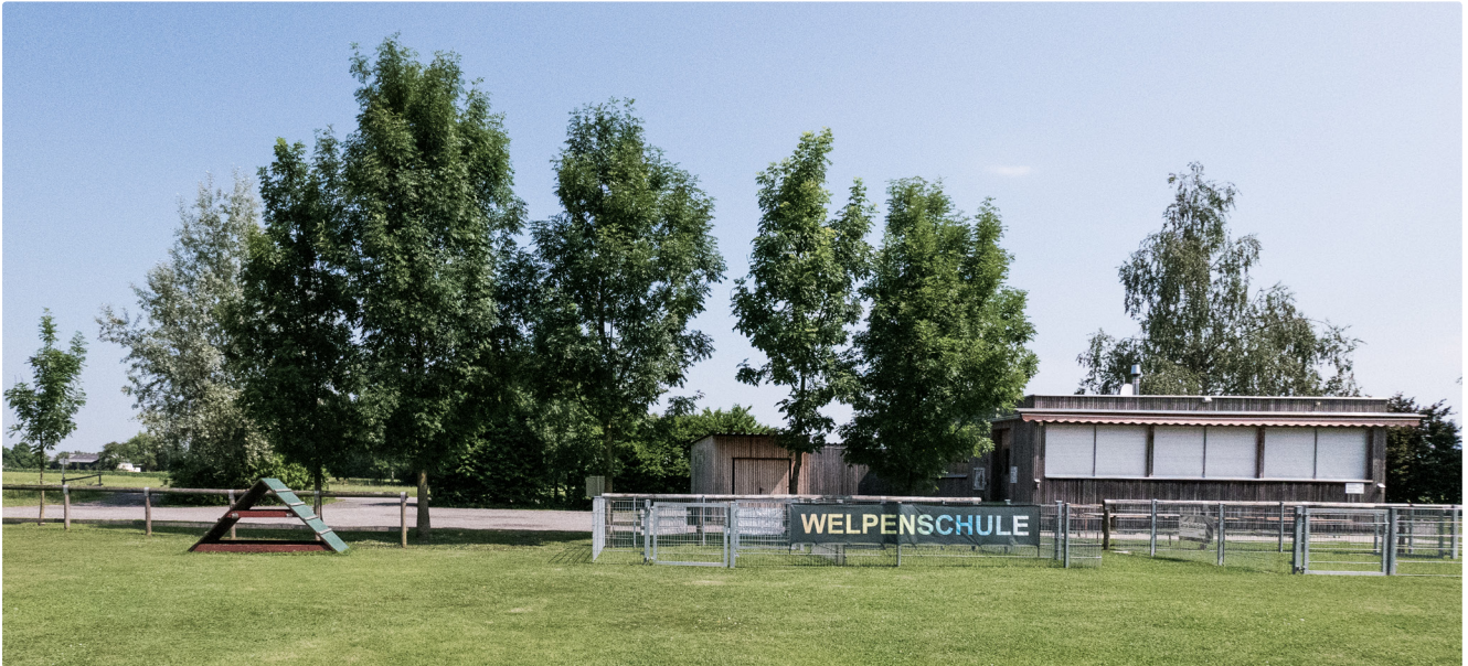
Lustenau, Riednutzung 1