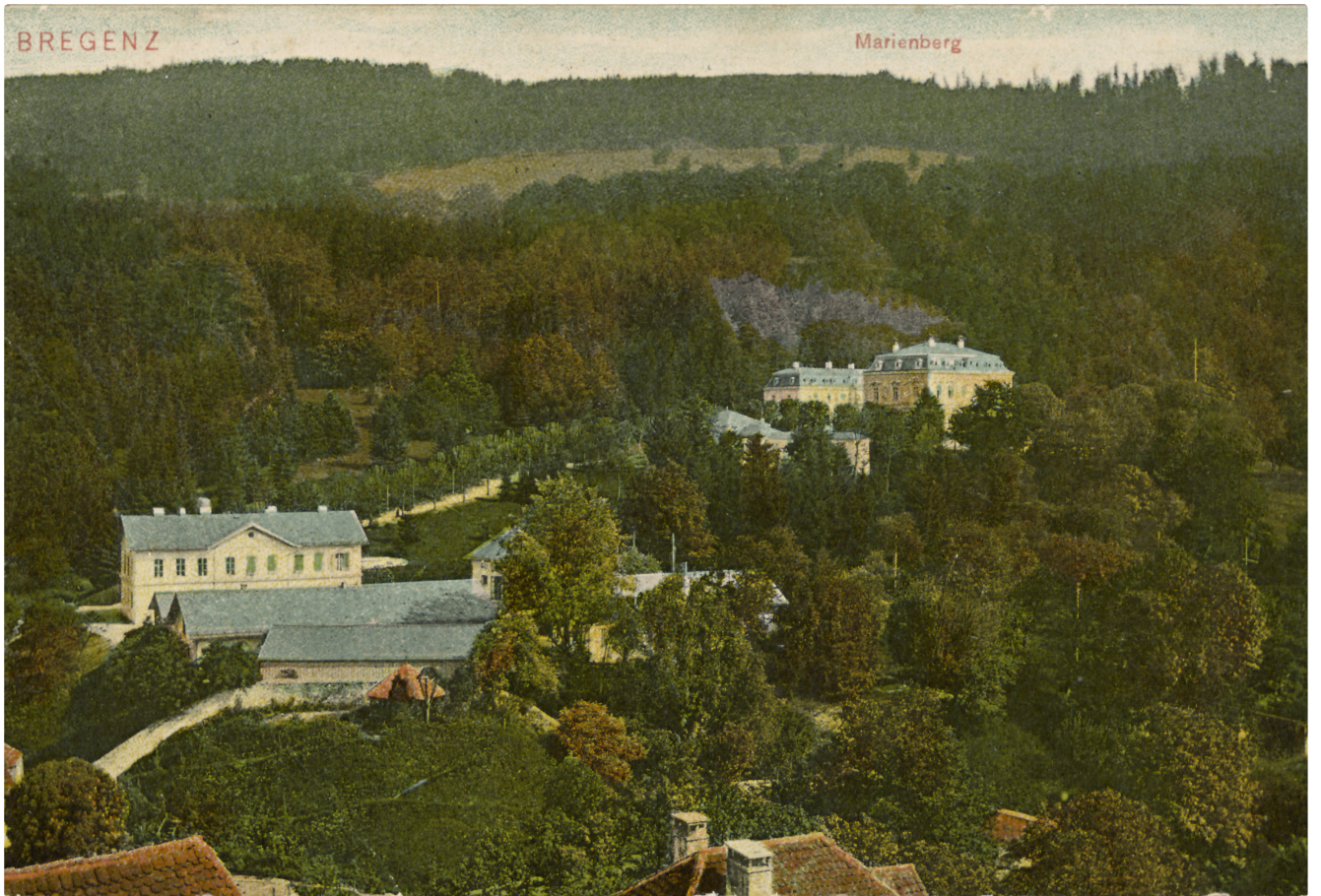
Villa Raczynski, Bregenz, um 1910