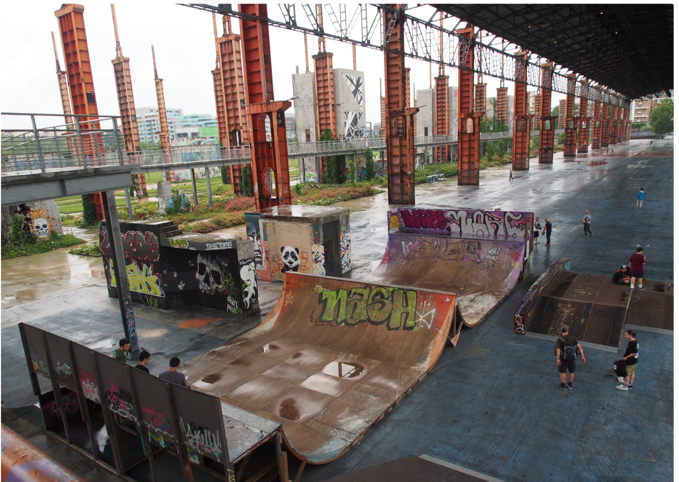
Funktionen in Parkanlagen passen sich dem Bedarf an: Überdachte Skateanlage im Parco Dora, Turin (Parkgestaltung Latz+Partner Landschaftsarchitekten 2012)