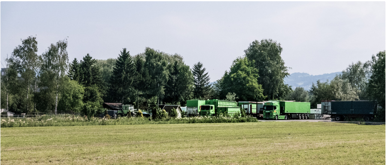
Lustenau, Riednutzung 2