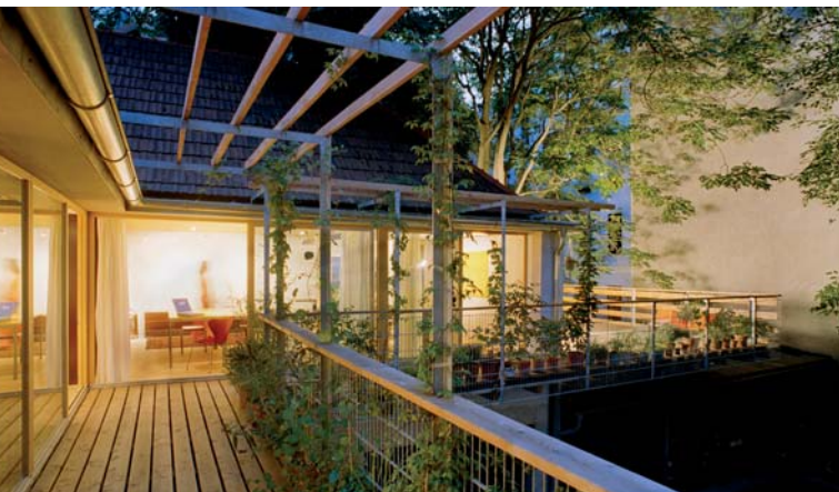
Erstes Wiener Strohhaus, 1060 Wien; Arch.: allmermacke

Na viac ako 30 peších a autobusových prehliadkach sprevádzajú väčšinou sami architekti. Každá prehliadka pozostáva z návštevy dvoch budov a jedného ateliéru, v ktorom sa na záver dozviete, ako sa z myšlienok rodia projekty a z projektov budovy.