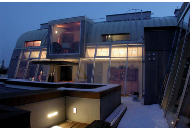
Dachausbau, 1090 Wien; Arch.: RaU Architekten