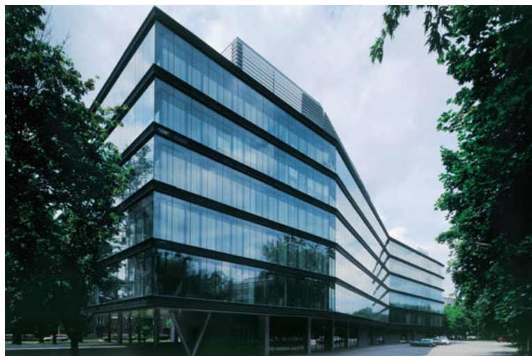
Büro- und Geschäftshaus Ingsteel / Polyfunktčný objekt Ingsteel, Bratislava Arch.: Lubomír Závodný, Daniel Priehoda, Foto: © Lubo Stacho

Netradičný pohľad na slovenskú architektúru neskorej moderny poskytnie výstava fotografií rakúskej fotografky Herthy Hurnaus „Die Ostmoderne“, ktorú v rámci „Architektúry znútra“ sprístupnia v Galérii Spolku architektov Slovenska.