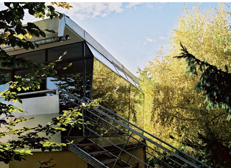
Haus L.; Arch.: gaupenraub+/-

Für die Bustour nach Bratislava ist ein Unkostenbeitrag von 16 Euro zu bezahlen./ Za autobusovú cestu do Bratislavy treba zaplatiť príspevok vo výške 16 Euro.