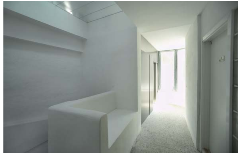
Stiegenhaus Basilikenhaus, 1010 Wien; Umbau: Veit Aschenbrenner Architekten

Dachausbau, 2004 Weihburggasse 14/15, 1010 Wien Arch.: Kurt Kempf