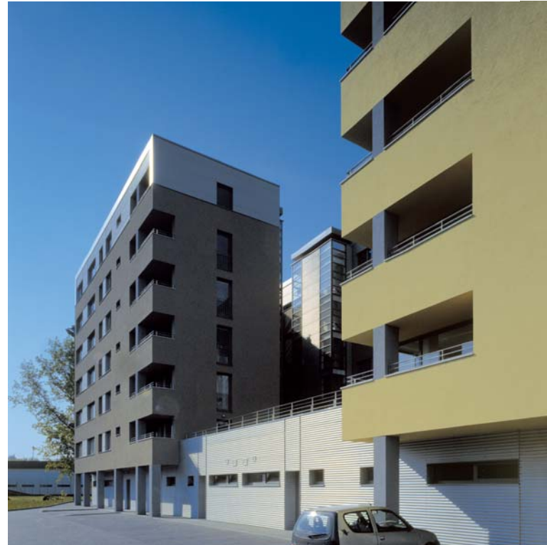
Wohnhaus Platan/Obytný dom Platan, Bratislava; Arch.: Juraj Polyák

Führung/sprevádzza: Andrej Alexy, Andrea Klimková