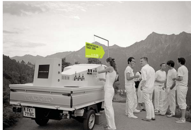
salon-mobile®; Gestaltung: OCPA büchel & büchel

Pri príležitosti rakúskeho predsedníctva v Rade Európy zasadne vo Viedenskom centre architektúry Európske fórum pre architektonickú politiku. V predvečer Dní architektúry, 8. júna 2006 o 19 h, sa bude v priestoroch Viedenského centra architektúry oslavovať. Európska architektonická slávnosť nepochybne zahájí tretie vydanie Dní architektúry medzinárodne a na úrovni.