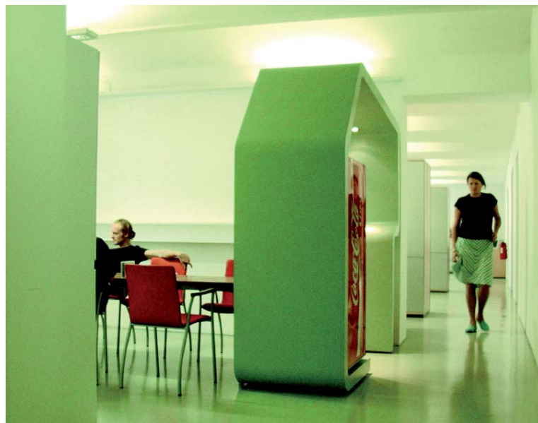
Werbeagentur CCP, Heye; Arch.: LOOPING architecture