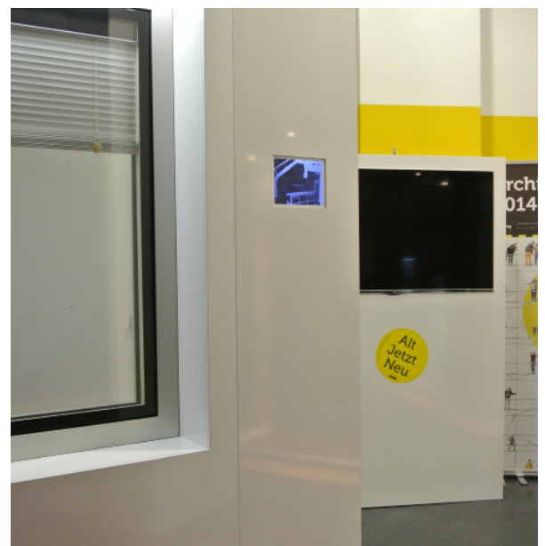
Eröffnungsfest Mondscheingasse, Wien; In Kooperation mit Internorm; Foto: art:phalanx