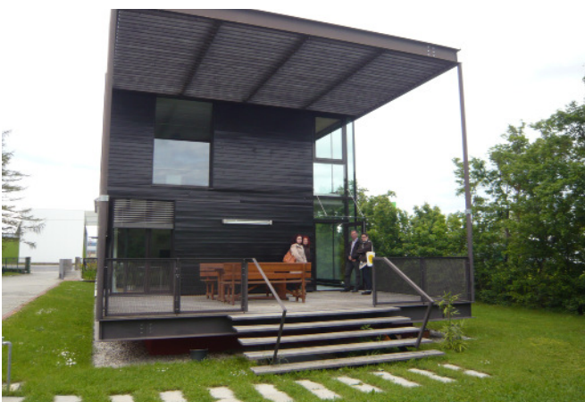
Bürogebäude Wildbach, Wr. Neustadt; Architektur: hochholdinger

Text: ORTE Architekturnetzwerk Niederösterreich