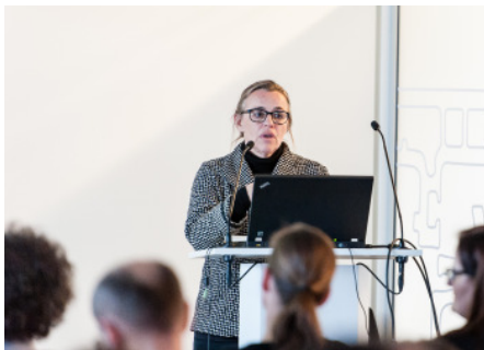
Vortrag; „draufsetzen“ Nachverdichtung und Architektur-Upcycling in Kooperation mit Internorm und architektur in progress; Zentrale IFN-Holding AG / Internorm in Traun, Foto: cityfoto