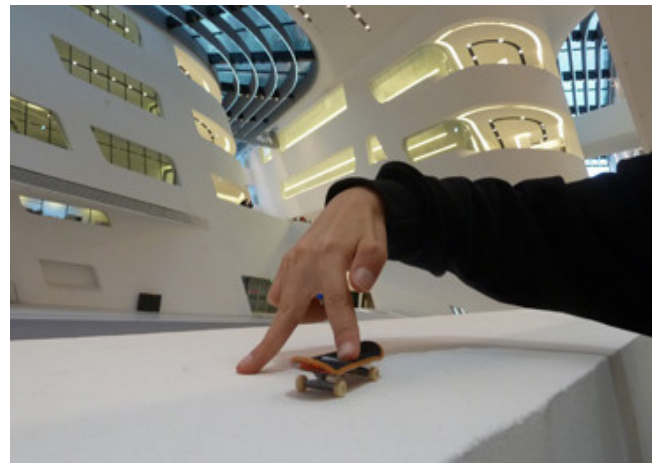
Kinder- und Jugendprogramm