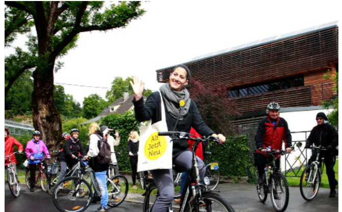
Radtour „Kontrapunkte“