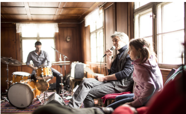
Konzert im Gasthaus Krone; Bezau

Text: vai Vorarlberger Architektur Institut