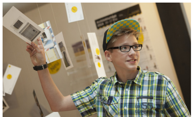
Fotosafari, Klagenfurt; Foto: Helga Rader