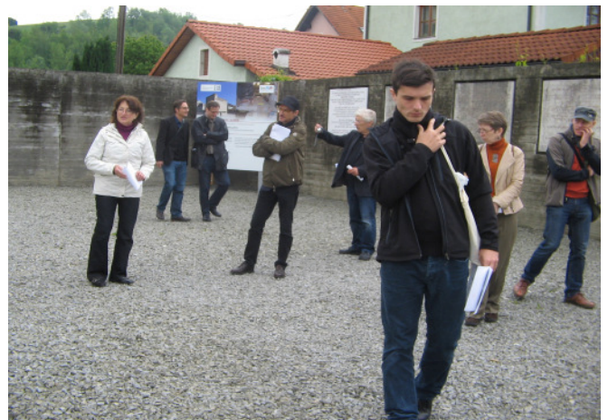
Memorial Gusen