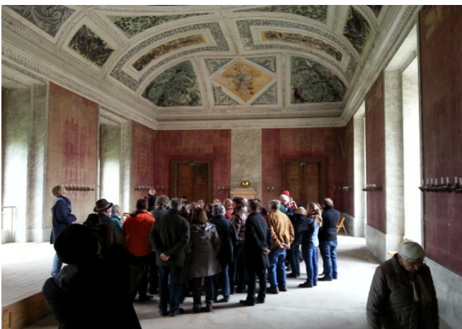
Schloss Ernstbrunn

Die beiden Fahrradexkursionen durch die Stadt St. Pölten und entlang der Sommerfrische-Strecke von St. Andrä-Wördern bis Klosterneuburg wurden wetterbedingt verschoben und am darauf folgenden Wochenende mit interessierten Architekturlaien durchgeführt.