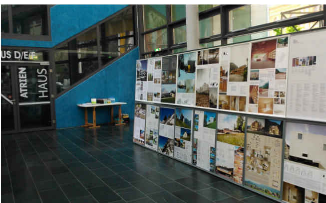
Fotoausstellung BHP