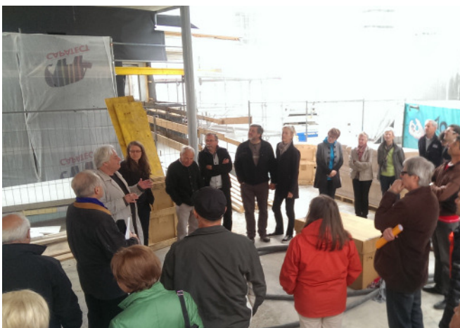
Stadtspaziergang Fließ

Unter dem Motto „Städte und Dörfer im Wandel“ konzentrierte sich das diesjährige Programm der Architekturtage in Tirol auf Stadtspaziergänge und Dorfwanderungen, bei denen gemeinsam mit ArchitektInnen und lokalen ExpertInnen Baukultur entdeckt werden konnte – sei sie alt oder neu. Erstmals bot sich der interessierten Öffentlichkeit die Möglichkeit, nicht nur in der Landeshauptstadt Innsbruck, sondern in mehreren, über das Bundesland verteilten Gemeinden am Programm der Architekturtage teilzunehmen. Ein Angebot, das dank des Engagements unserer ProjektpartnerInnen und der Ankündigung der Veranstaltungen in den Bezirksmedien überall großen Anklang gefunden hat. Durchschnittlich 50 bis 60 Interessierte, von Fachpublikum bis zur ortsansässigen Bevölkerung und von Jung bis Alt, begleiteten die Führungen in Fließ, Hall, Hopfgarten, Lienz, Rattenberg, Telfs und Zirl. Das Echo war durchwegs positiv, das „Ins-Land-Hinausgehen“ wird in zwei Jahren sicher wiederholt.