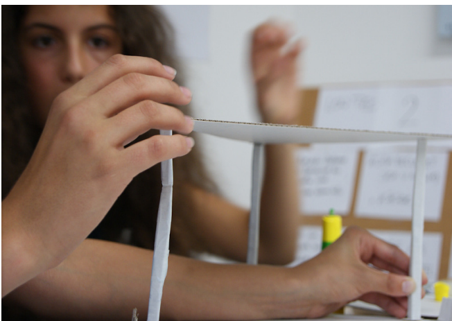
Kinderprogramm; Foto: Kinder Uni Steyr