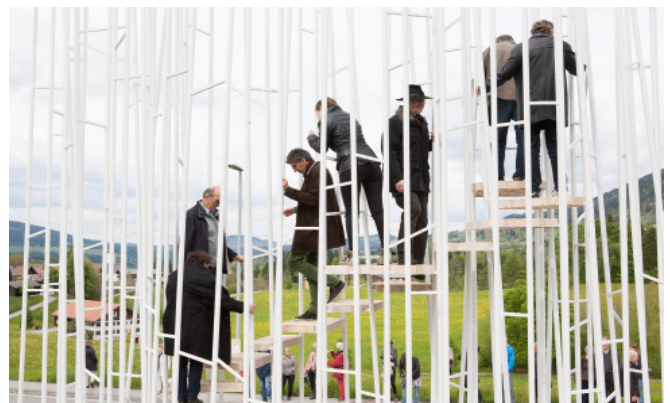
Busstation Krumbach; Architektur: Sou Fujimoto