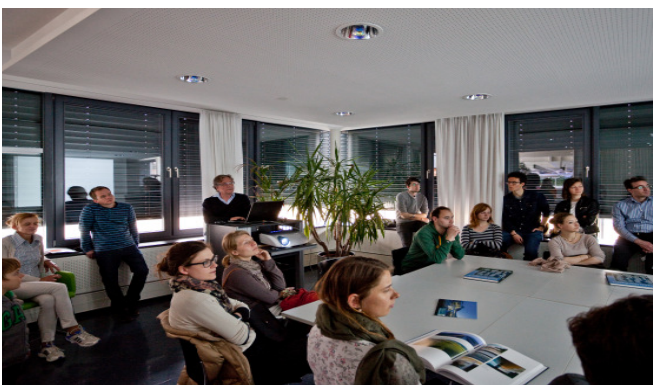
Offenes Atelier Giselbrecht