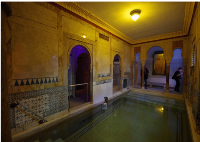
Geführte Tour; Centralbad; Foto: Wolf Leeb

Text: ÖGFA Österreichische Gesellschaft für Architektur