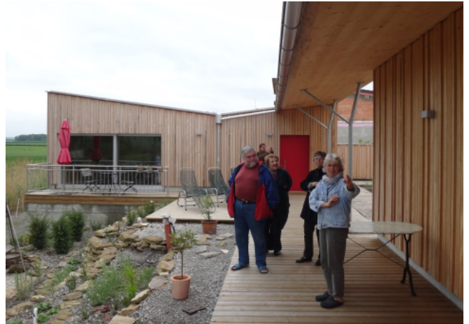
Bungalow, Althöflein; Architektur: Architekt Abendroth

Peter Holzer und Markus Rehberger gaben unter dem Titel „Hilfe – altes Haus“ HausbesitzerInnen, profunde Informationen zum adäquaten Umgang mit bestehender Wohnbausubstanz mit dem Fokus auf thermische Sanierung und allen bestehenden Fördermöglichkeiten.