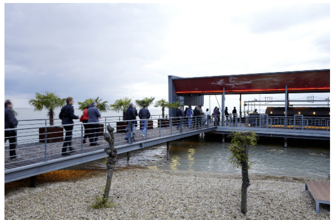
Schauplatz Film „Flucht ins Schilf“; Mole West; Architektur: Halbritter & Hillerbrand; Foto: Rainer Schoditsch