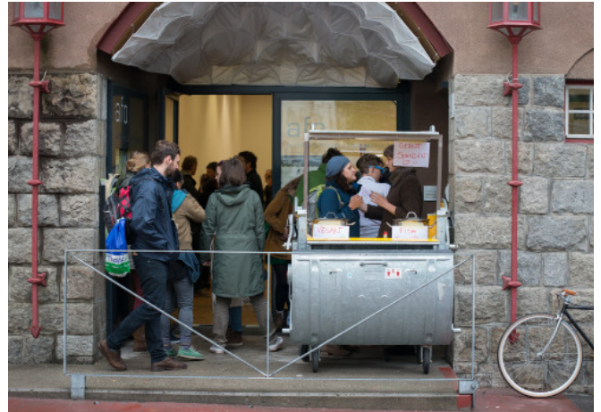
Filmvorführung im afo; Foto: afo