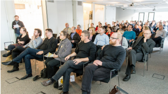
Vortrag; „draufsetzen“ Nachverdichtung und Architektur-Upcycling in Kooperation mit Internorm und architektur in progress; Zentrale IFN-Holding AG / Internorm in Traun