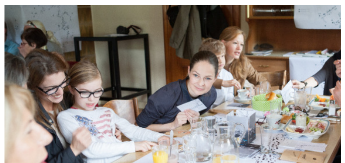
Vorarlberg; Foto: Roswitha Natter