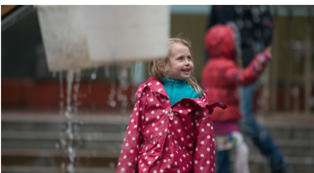
Oberösterreich; Foto: Petra Moser

Im Mittelpunkt des Interesses stand bei allen Veranstaltungen die Experimentierfreudigkeit. Dabei kamen die spielerischen und vergnüglichen Komponenten auf keinen Fall zu kurz. Die abwechslungsreichen Einfälle der KuratorInnen, Architektur an die BauherrInnen der Zukunft zu vermitteln, kamen gut an - wie die folgende Bildergalerie veranschaulicht. Denn die zahlreichen BesucherInnen waren mit viel Entschlossenheit und Begeisterung bei der Sache.