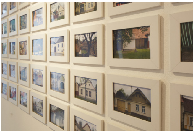
Ausstellung „Die Zukunft burgenländischer Streckhäuser“; Foto: ARCHITEKTUR RAUMBURGENLAND

Auch zu den - zur Ausstellung thematisch angepassten Führungen - kamen im Schnitt ca. 30 Besucher und Besucherinnen. Dabei hatten Interessierte die Möglichkeit mit den PlanerInnen und BauherInnen in einen spannenden Dialog zu treten.