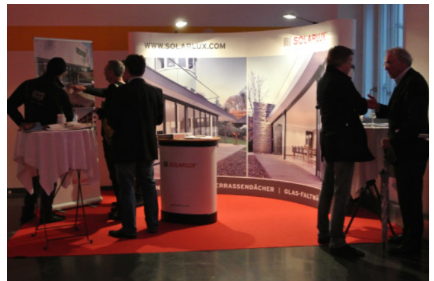
Eröffnungsfest Mondscheingasse, Wien; In Kooperation mit Solarlux; Foto: art:phalanx