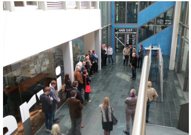
Fotoausstellung BHP

Das Wetter spielte im Süden Österreichs mit und die besonderen Outdoor - Highlights wie die Architekturschiffahrt am Ossiacher See und die Radtour von Klagenfurt nach Maria Saal konnten wie geplant stattfinden. Den Rahmen für den Abschluss der ereignisreichen Architekturtag bildete die raumgreifende Installation „Blattwerk“. Das große Fest war zugleich Startschuss für den nun folgenden ARCHITEKTUR HAUS SOMMER.