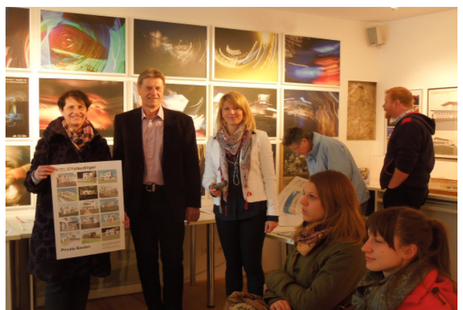
Atelier Staudinger, Wolkersdorf