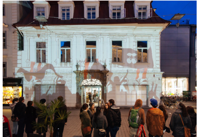
„Dialog in der Zeit“