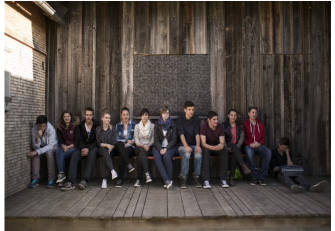
„1000 Häuser“; Alte Säge Bezaus