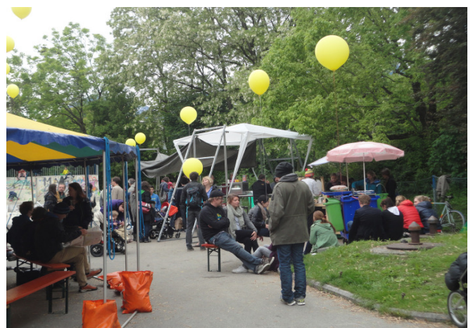
Rapoldipark; Foto: aut