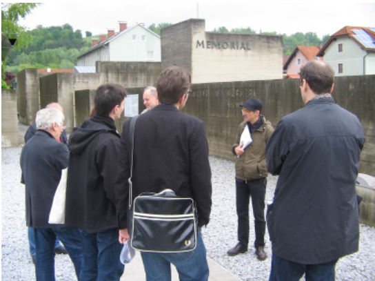
Geführte Tour; Memorial Gusen; Architektur: BBPR; In Kooperation mit Bundeskanzleramt Österreich; Foto: afo