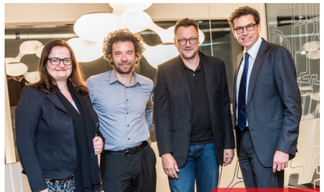
Vortrag; „draufsetzen“ Nachverdichtung und Architektur-Upcycling in Kooperation mit Internorm und architektur in progress; Zentrale IFN-Holding AG / Internorm in Traun, Foto: cityfoto