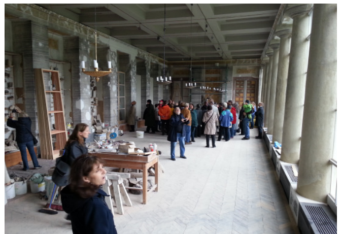
Schloss Ernstbrunn