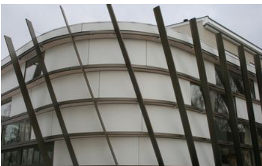
Offenes Gebäude; Pfarre Hermau in Salzburg; Architektur: Michael Strobl; In Kooperation mit Rockwool; Foto: Rockwool