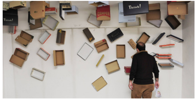
Wohn-Raum-Installation von NMS Maxglan