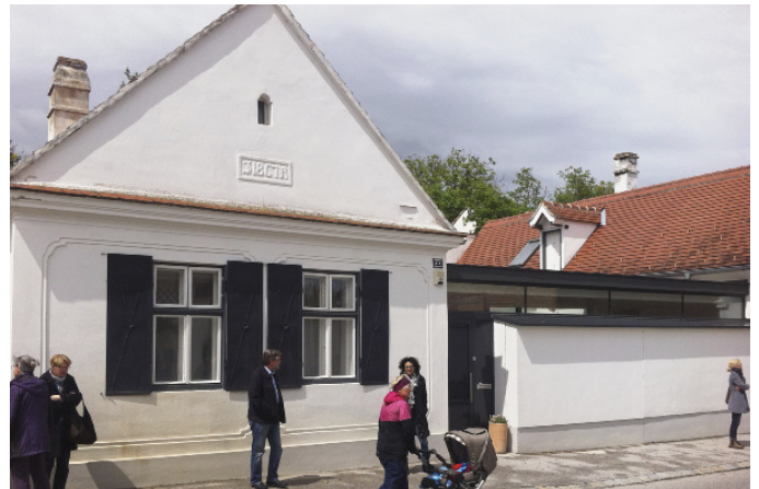
Führung „Die Zukunft burgenländischer Streckhäuser“; Foto: ARCHITEKTUR RAUMBURGENLAND

Weiters wurde eine Radtour und erstmalig an zwei Standorten (Eisenstadt und Stadtschlaining) Architekturworkshops für Kinder und Jugendliche angeboten. Die Veranstaltungen für junge Architektur-Interessierte wurden so gut angenommen, dass eine Fortsetzung bei den Architekturtagen 2016 geplant ist.