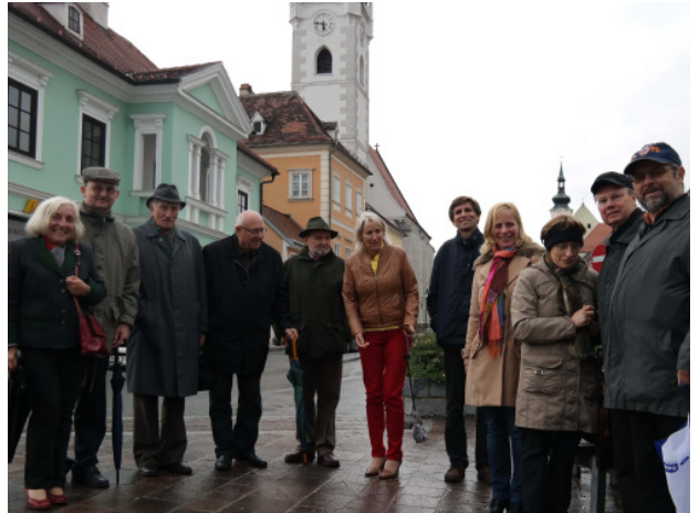
„Fassadenlesen“, Horn; Foto: ORTE