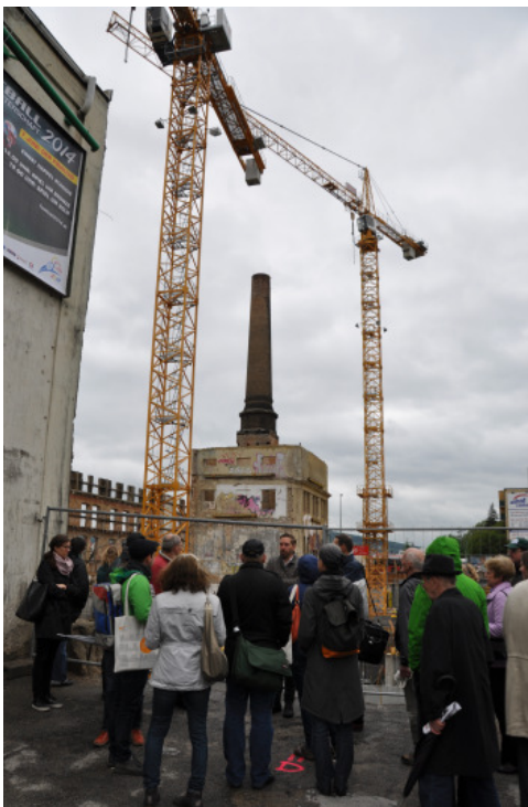
Grätzeltour Wien; Alt Arbeit Jetzt Wohnen_GB*6/14/15; ehemalige GEBE-Fabrik; In Kooperation mit wvg/Familienwohnbau; Foto: art:phalanx