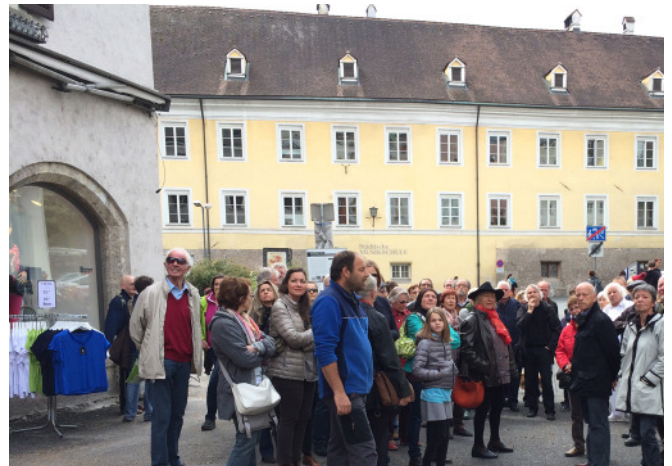
Stadtspaziergang, Hall; Foto: aut