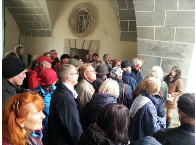
Führung; Schloss Ernstbrunn; In Kooperation mit Bundeskanzleramt Österreich; Foto: ORTE