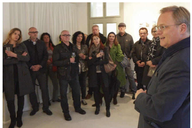
Eröffnung „Die Zukunft burgenländischer Streckhäuser“; Foto: ARCHITEKTUR RAUMBURGENLAND