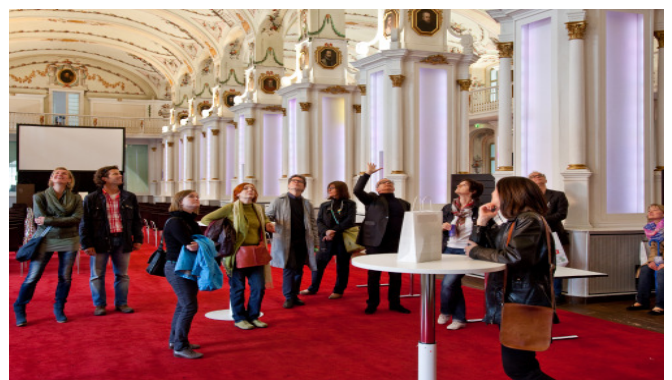
Alte Universität, Graz; Architekt Bramberger