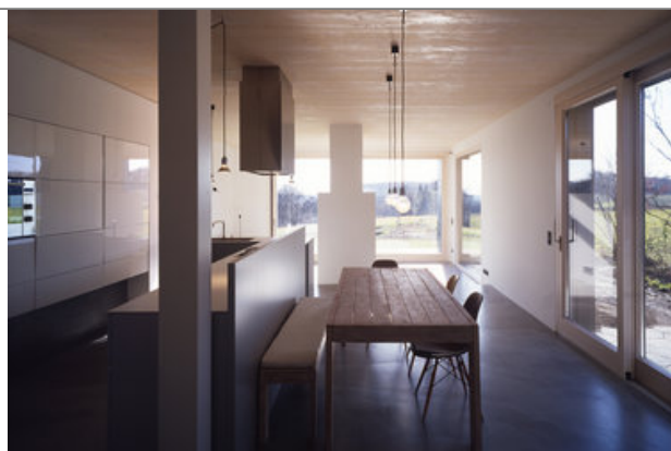
Zweifamilienhaus Hadersfeld, Architektur: triendl und fessler architekten

Gemeinsam mit den Bauherrinnen und Bauherren zeigen Architekten und Architektinnen einen Nachmittag lang direkt am Gebäude, was gute Architektur leisten kann.