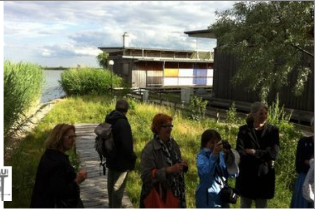
Architektur per pedes - Von Winden nach Jois