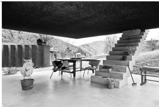
Weichlbauer / Ortis, efh_surplus value01, Laufnitzdorf, weichlbauer / ortis