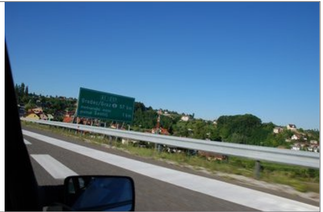
Gradec - Marburg: 53 Minuten, Foto: Marie Neugebauer