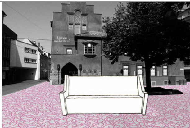
Highlight 1 Herbert-Bayer-Platz Linz, afo