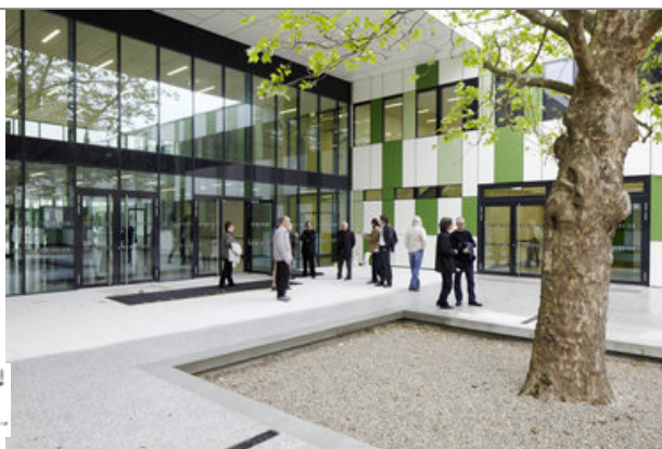
Architekturtage 2012