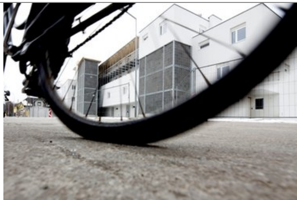
Wohnanlage Leutschacherstrasse in Klagenfurt, Foto: dermaurer, Arch: Eva Rubin

Wir setzen auf Nachhaltigkeit – nicht nur beim Bauen!