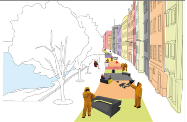
Wohnzimmer Ennskai, Dietmar Lassingleithner