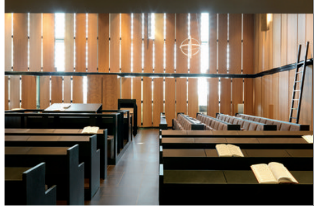
Synagoge Zvi Perez Chajes Campus, Wien, Paul Ott

Wo immaterielle Werte beheimatet sind, können auch neue Möglichkeiten für Architektur entstehen. Anlässlich der zeitgleich stattfindenden "Langen Nacht der Kirchen" besuchen wir einen Klassiker des modernen katholischen Sakralbaus und zwei aktuelle Lösungen im dichten, von zahllosen Sinneseindrücken geprägten städtischen Gefüge, die alle drei in unterschiedlicher Form und vor unterschiedlichen Hintergründen auf die Reduktion und Bündelung architektonischer Mittel setzen und damit Räume für Besinnung und Einkehr, aber auch für Feierliches schaffen.