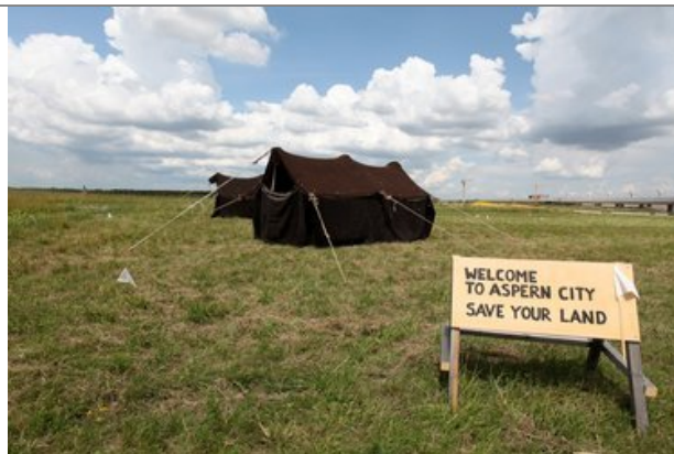
aspern und das Paradoxon der Roten Königin, Copyright: dadaX

Mit diesem Link geht's direkt zum Sonntag in aspern Seestadt!