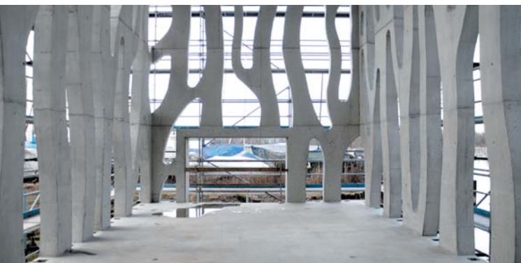
Clubhaus Rohner; Architektur: Baumschlager & Eberle; Foto: © Reinhard Utenthaler