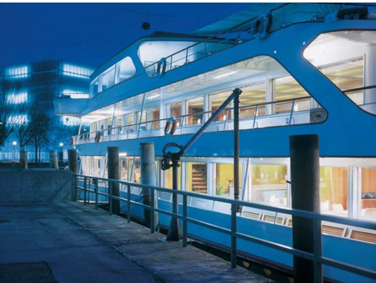
Die MS Vorarlberg; Umbau und Restaurierung: Christian Lenz; Foto: © Ignacio Martinez

Der erste Tag klingt mit einem Fest auf dem Bodenseeschiff MS Vorarlberg aus. Das Schiff gleitet entlang der Bregenzer Bucht, am Programm stehen literarische Skizzen zur österreichisch-schweizerischen Oberfläche und der Ausblick auf dort entstehende Projekte.