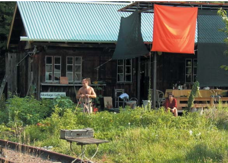
Viscoseareal Widnau; Architektur: Spallo Kolb