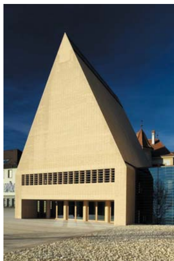
Landtag Fürstentum Liechtenstein; Architektur: H. Göritz u. Frick Architekten