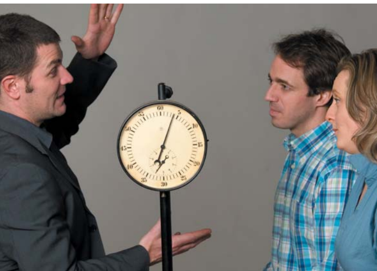
Speed Dating: Architekt – Bauwillige

Zwischenmenschliche Kommunikation ist eine große Herausforderung und beinhaltet mitunter eine Quelle von Missverständnissen. Das gilt auch für die Verständigung zwischen ArchitektInnen und Menschen mit Bauabsichten. ArchitektInnen, verantwortlich für das Planungsgeschehen und die Umsetzung, müssen viele Qualifikationen in sich vereinen. Nicht immer gelingt es, im Gespräch die Brücke zu demjenigen zu schlagen, der bereit wäre, sein Vertrauen, sein Geld und seine Wünsche in die Hand eines Architekten/einer Architektin zu legen. Weil Baukultur auch Gesprächskultur ist, soll ein Speed Dating mit ArchitektInnen zukünftigen BauherrInnen die Möglichkeit geben, unverbindlich ins Gespräch zu kommen und zuzuhören, ob das Gegenüber der Architekt/die Architektin des Vertrauens sein könnte.