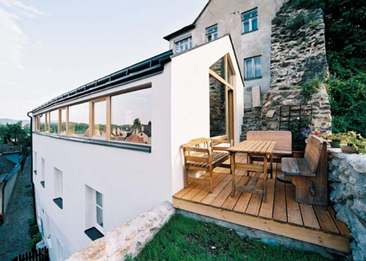
Dachgeschosswohnung, Krems-Stein; Architektur: einzueins architektur

Was verbirgt sich hinter der Fassade? Wie wohnt es sich unterm Altstadt-Dach? Die Architekturjournalistin und Mitglied des Kremser Gestaltungsbeirates Franziska Leeb gibt gemeinsam mit ArchitektInnen, BauherrInnen und NutzerInnen Einblicke in nicht allgemein zugängliche Bereiche öffentlicher Bauten, in private Refugien und in die Entstehungsbedingungen von Architektur in Krems.