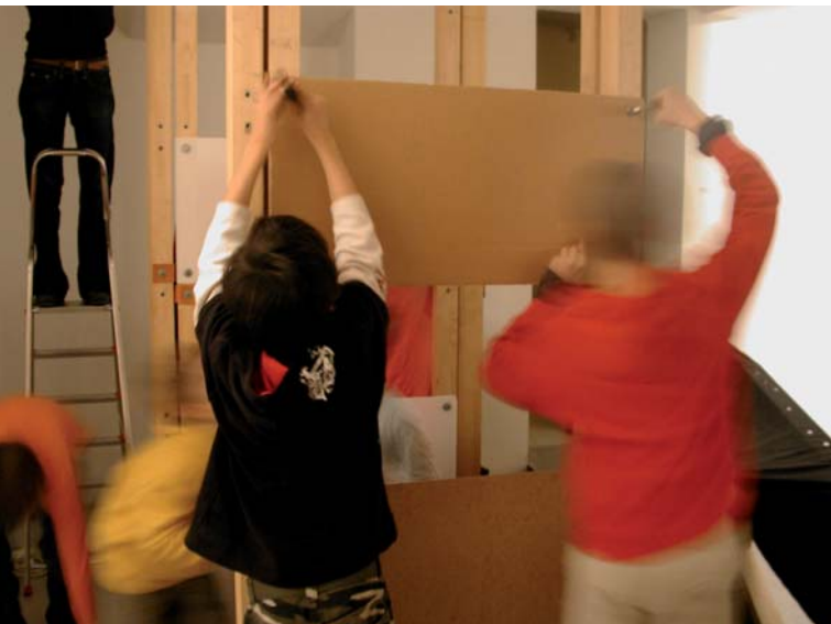
Workshop raum mobil m 1:1

Ein spezielles Programm für junge BesucherInnen mit Informationen rund um den Beruf „ArchitektIn“ und der Möglichkeit, selbst Räume zu gestalten, findet im aut statt. Aus einer Vielzahl an Materialien und mit dem „raum mobil m 1:1“ können die TeilnehmerInnen mit einem großen, begehbaren und erlebbaren Raum experimentieren und mit Licht, Stoff und anderen Materialien Räume ganz nach den eigenen Vorstellungen gestalten. Workshop mit Monika Abendstein (Architektin) und Astrid Schöch (aut. architektur und tirol)