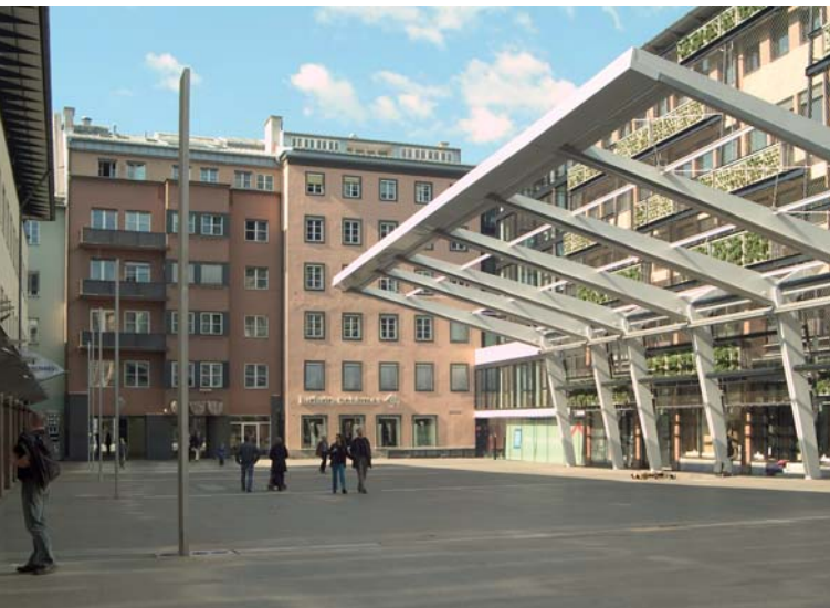
Sparkassenplatz Innsbruck; Architektur: Johannes Wiesflecker

Gemeinsam mit Stephan Bstieler (Baubeauftragter der Sparkasse) führt Johannes Wiesflecker (Architekt) durch die neuen Räumlichkeiten der Sparkasse und stellt das aktuelle Projekt, die Aufstockung des Hauses Sparkassenplatz 2, in den Räumlichkeiten des Wohnquadrats vor.