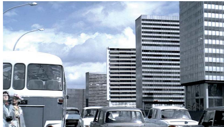
Standbild aus dem Film „Playtime“