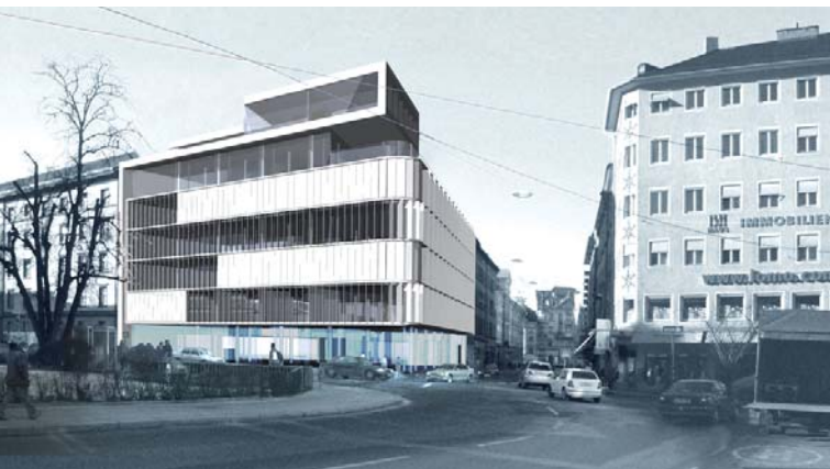
Hypo Tirol Bank; Architektur: Schlögl & Süss Architekten Simulation: © Schlögl & Süss Architekten

Kaufhaus Tyrol, 2006-2008, Architektur: Obermoser arch-omo Zt GmbH Hypo Tirol Bank, 2006-2008, Architektur: Schlögl & Süss Architekten Landhaus 1: Neubau, Grundsanierung, Funktionsadaptierung, 2006-2008, Architektur: Obermoser arch-omo Zt GmbH, Schlögl & Süss Architekten